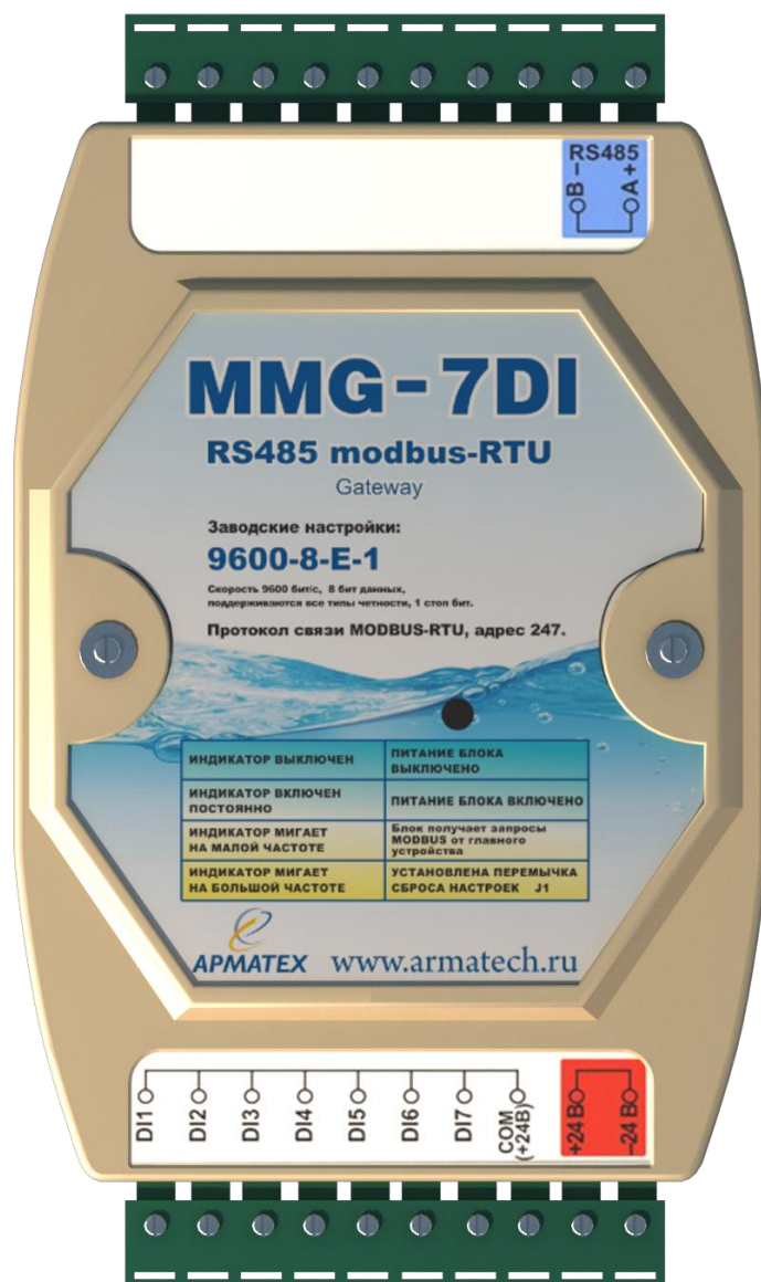
Рисунок 1. Внешний вид блока

1.4.1 Блок состоит из корпуса и размещенной в нем платы. На передней панели корпуса имеется индикатор. Сбоку на корпусе находятся разъемы для подключения винтовых клемм. Внешний вид блока с присоединенными клеммами представлен на рисунке 1.